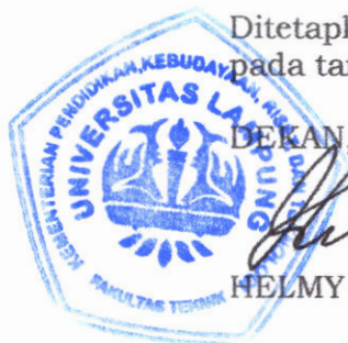
HELMY FITRIAWAN →

Ditetapkan di Bandar Lampung pada tanggal 1 November 2024