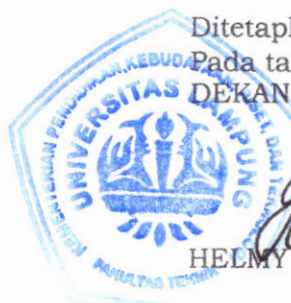
HELMY FITRIAWAN )